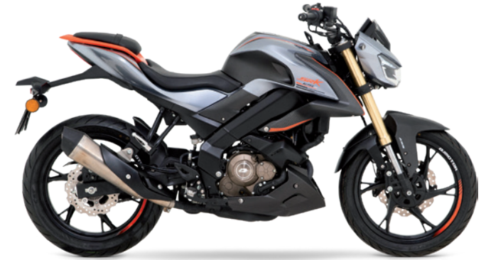
Polargrau / Orange