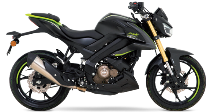
Matt-Schwarz / Lime