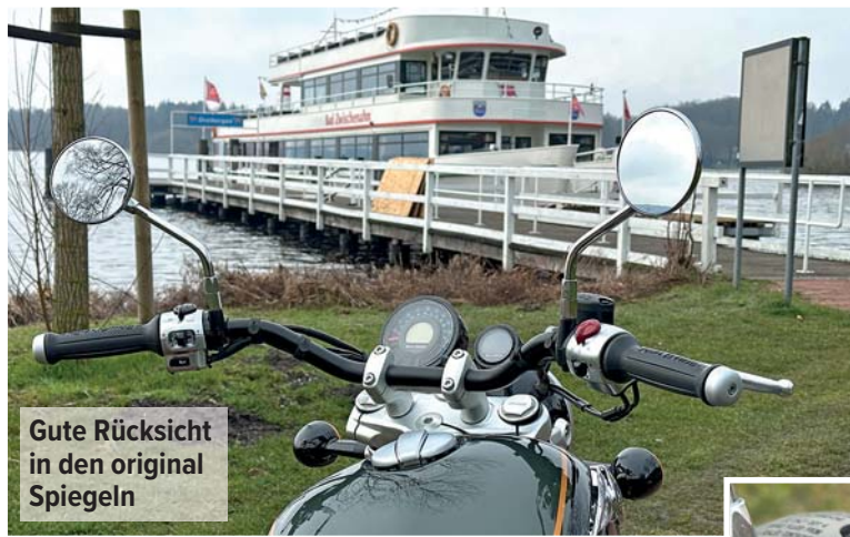
Gute Rücksicht in den original Spiegeln