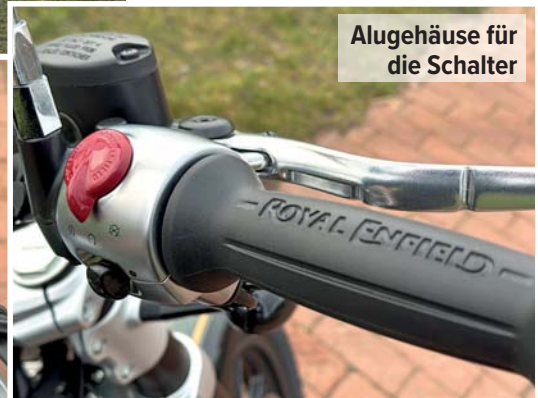
Alugehäuse für die Schalter