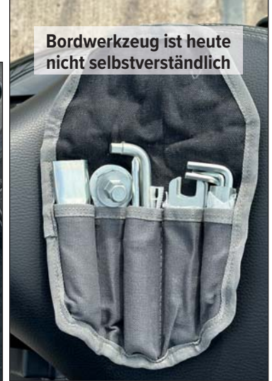
Bordwerkzeug ist heute nicht selbstverständlich