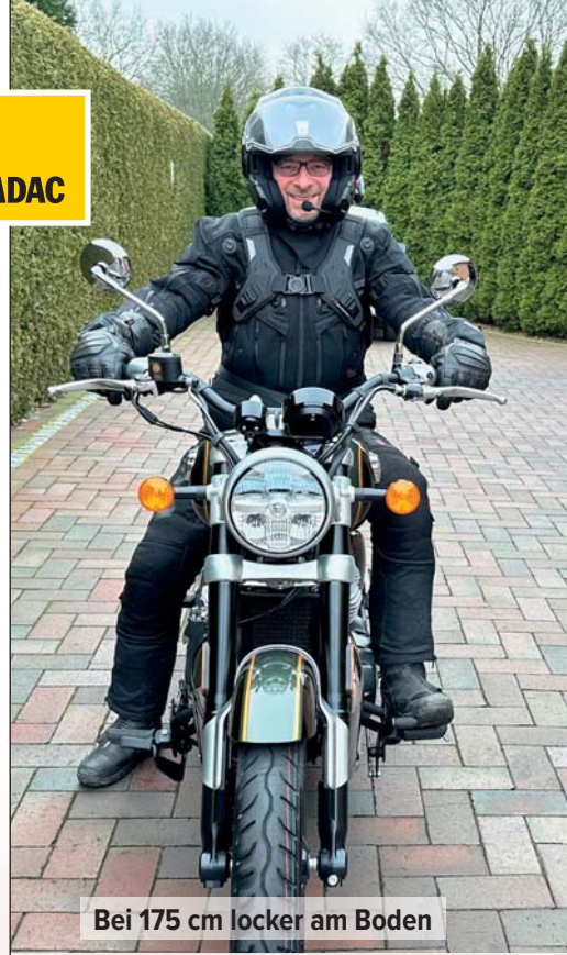
Bei 175 cm locker am Boden

Gut gefällt mir das Cockpit: alle Infos inkl. einer Ganganzeige hat man direkt im Blick. Über einen Taster lassen sich lediglich Gesamtkilometer sowie Tageskilometerzähler A und B umschal-