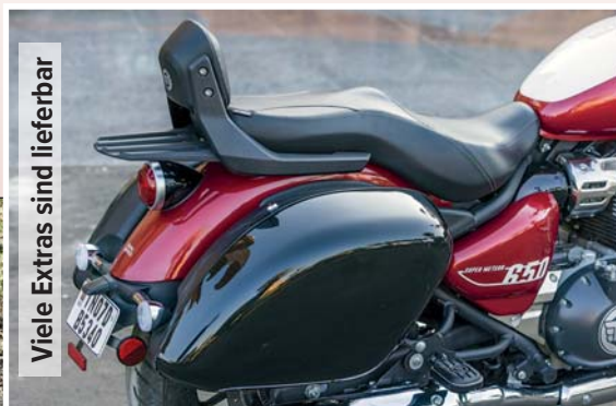
Viele Extras sind lieferbar

15,7 Liter Tankinhalt geben rein rechnerisch 350 Kilometer Reich-