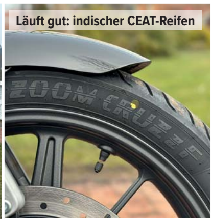
Läuft gut: indischer CEAT-Reifen