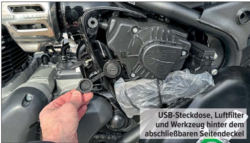
USB-Steckdose, Luftfilter und Werkzeug hinter dem abschließbaren Seitendeckel