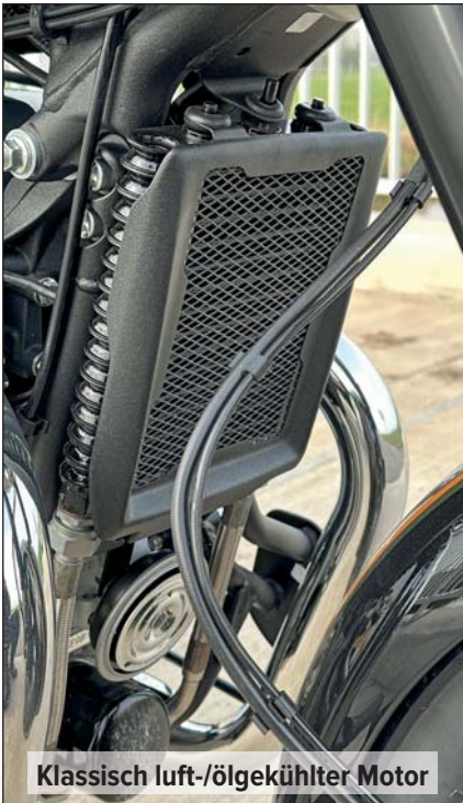
Klassisch luft-/ölgekühlter Motor