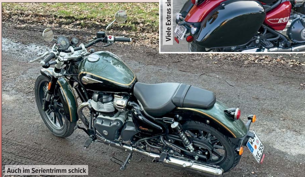
Auch im Serientrimm schick