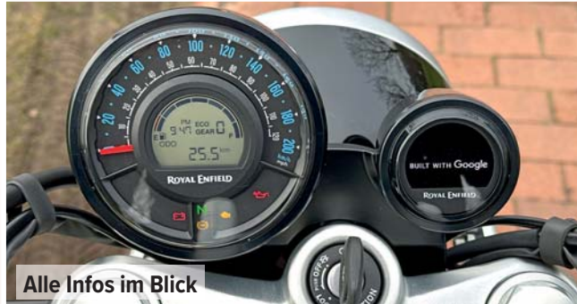
Alle Infos im Blick