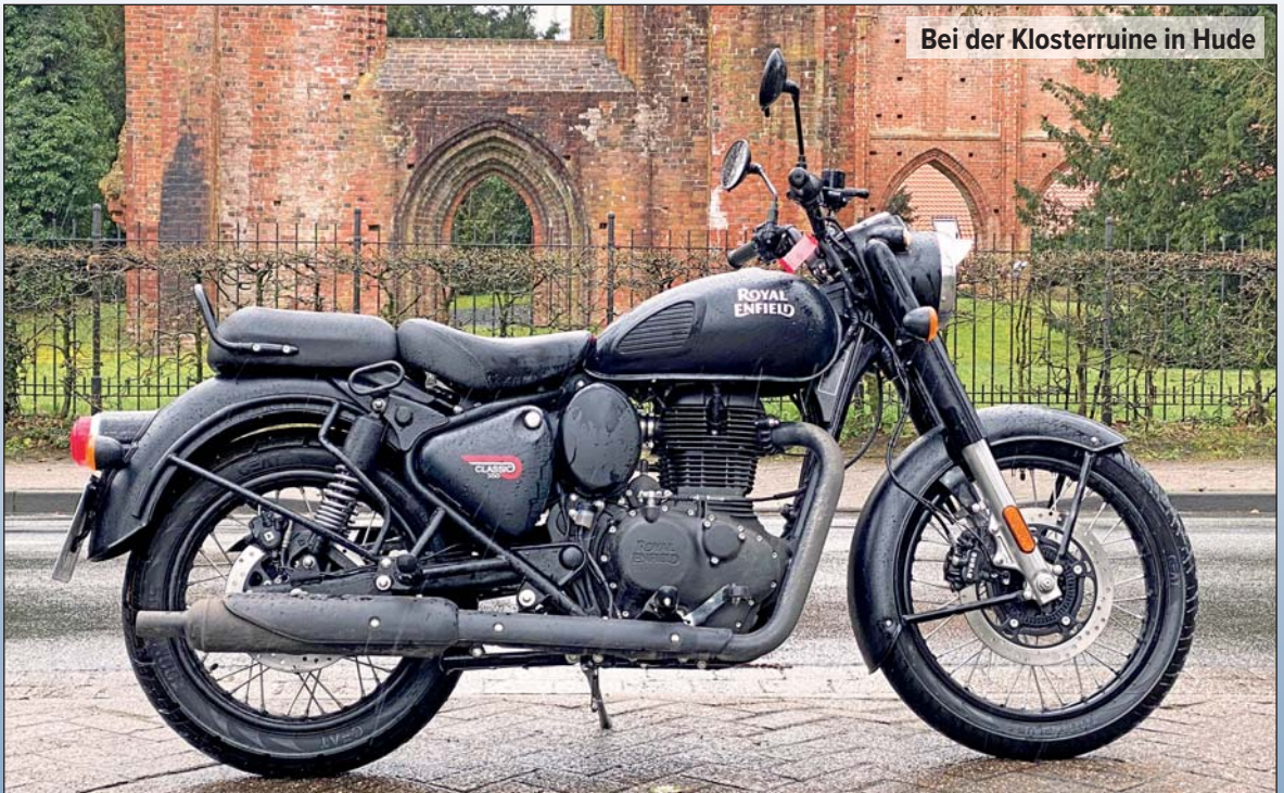
Bei der Klosterruine in Hude