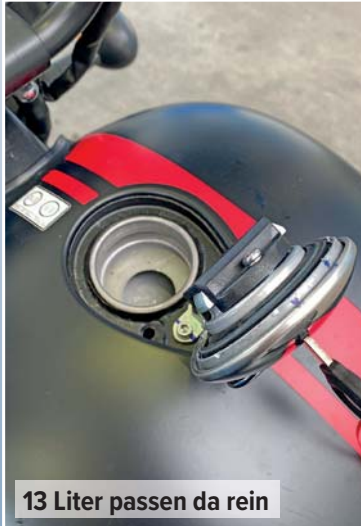
13 Liter passen da rein