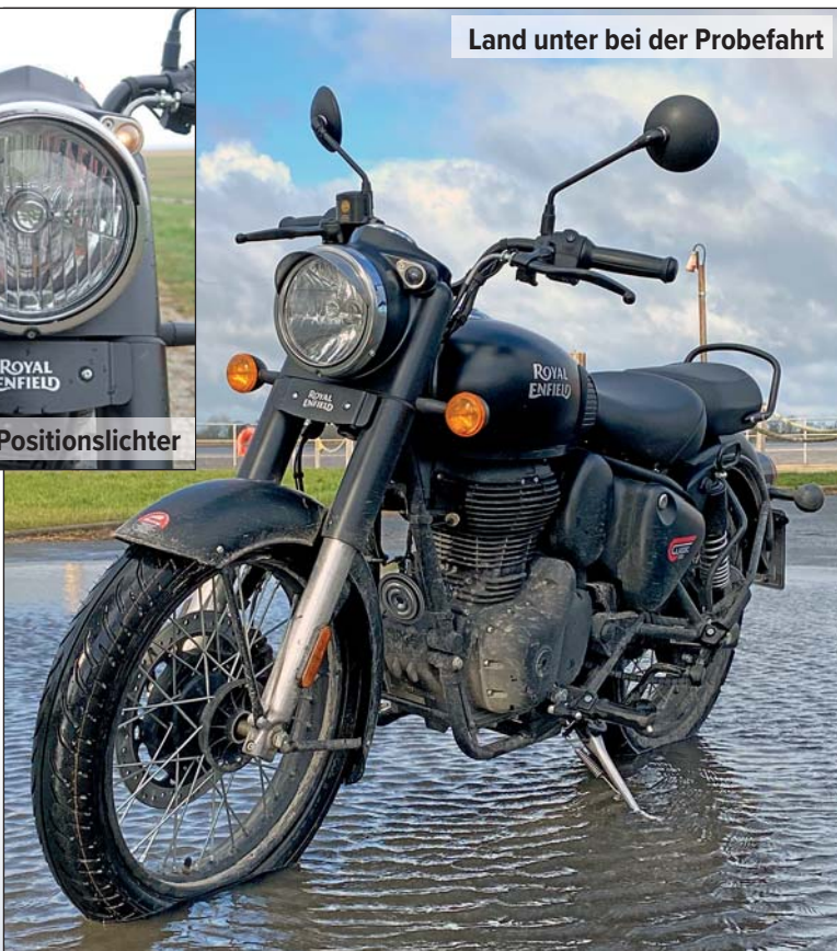
Land unter bei der Probefahrt