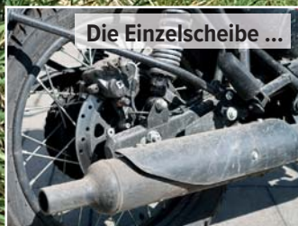
Die Einzelscheibe ...