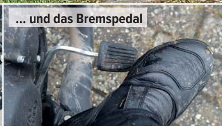
... und das Bremspedal

Umstände hatte ich keine unsicheren Momente. Auch auf kalter und nasser Straße greift das ABS beim Bremsen erst spät ein, Grip ist also da. Eine Traktionskontrolle vermisst man angesichts der geringen Leistung zu keinem Zeitpunkt. Ich könnte mir allerdings vorstellen, die Classic 350 etwas gröber zu bereifen, denn auch auf Feldwegen macht der Einzylinder mit seinen 170 mm Bodenfreiheit viel Spaß. Da könnten die Inder doch noch einen Scrambler nachschieben, das bietet sich ja geradezu an.