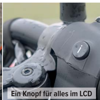
Ein Knopf für alles im LCD