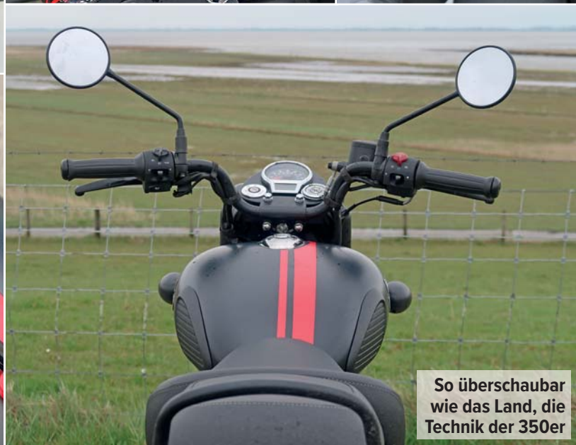
So überschaubar wie das Land, die Technik der 350er