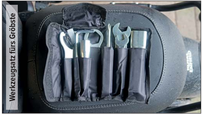
Werkzeugsatz fürs Größte