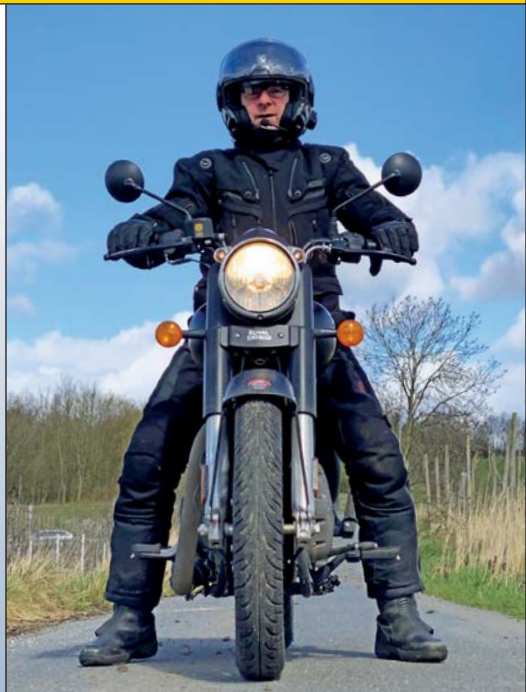
Angenehm niedrige Sitzposition (Fahrer 175 cm)